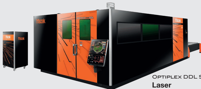
OPTIPLEX DDL SERIES Laser