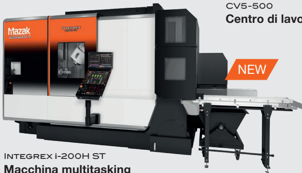
INTEGREX I-200H ST Macchina multitasking