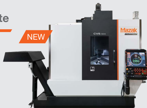
CV5-500 Centro di lavoro 5 assi new concept