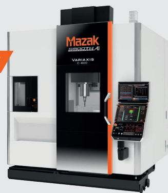
VARIAXIS C-600 Centro di lavoro verticale a 5 assi