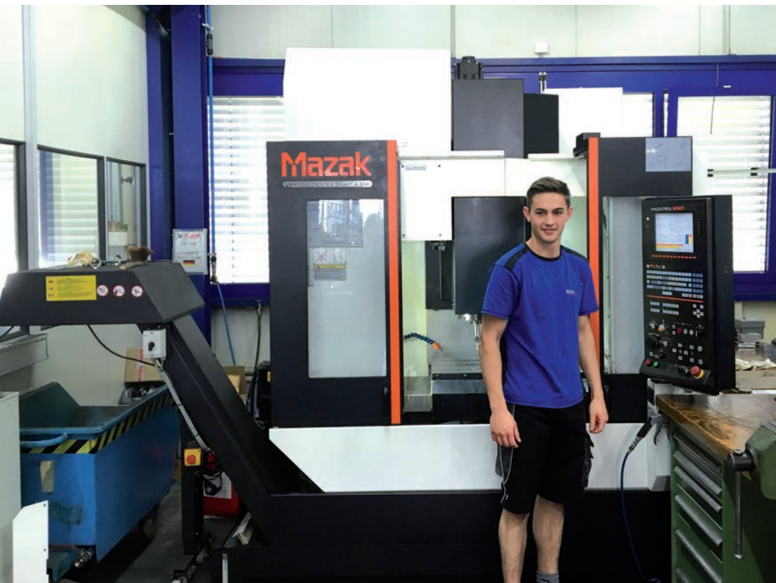
Die jüngste Maschine aus dem Hause Mazak: ein Vertical Center Smart