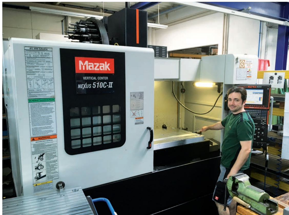
2008 ging die zweite Mazak Maschine - ein Vertikal-Bearbeitungszentrum Nexus - bei ZIPO in Betrieb.